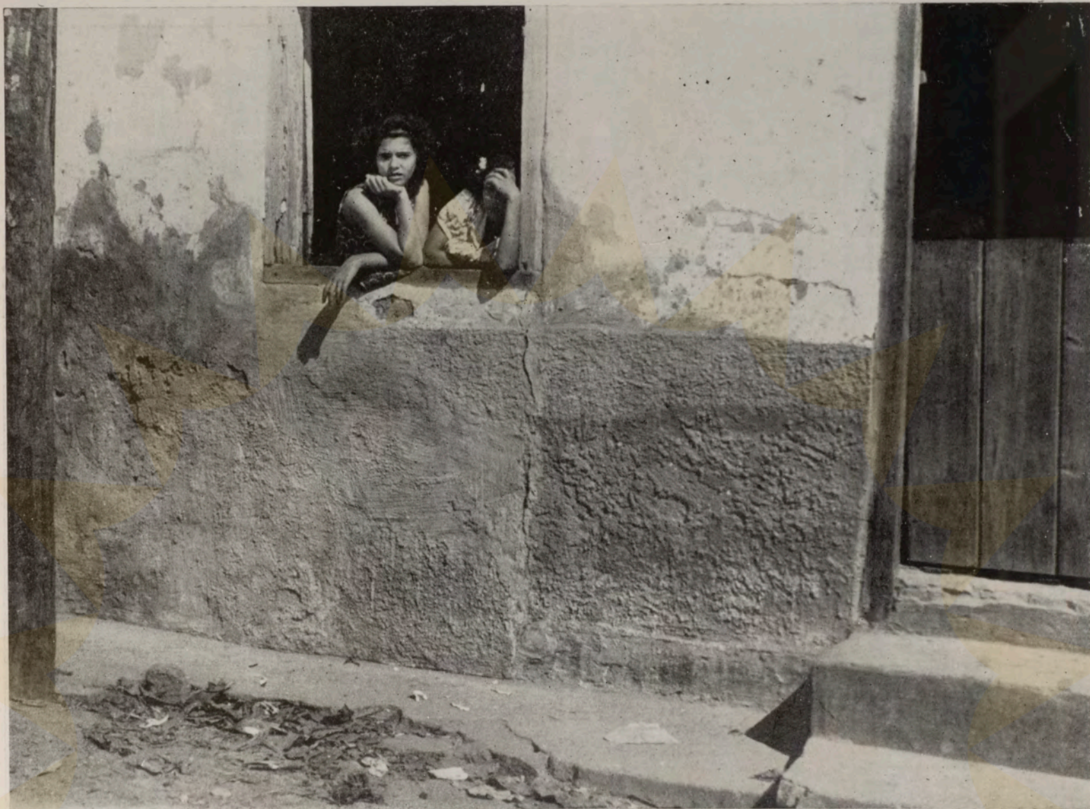
Janela no bairro popular