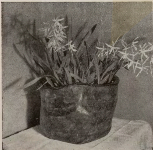
Flores num copo de E. Nobiling