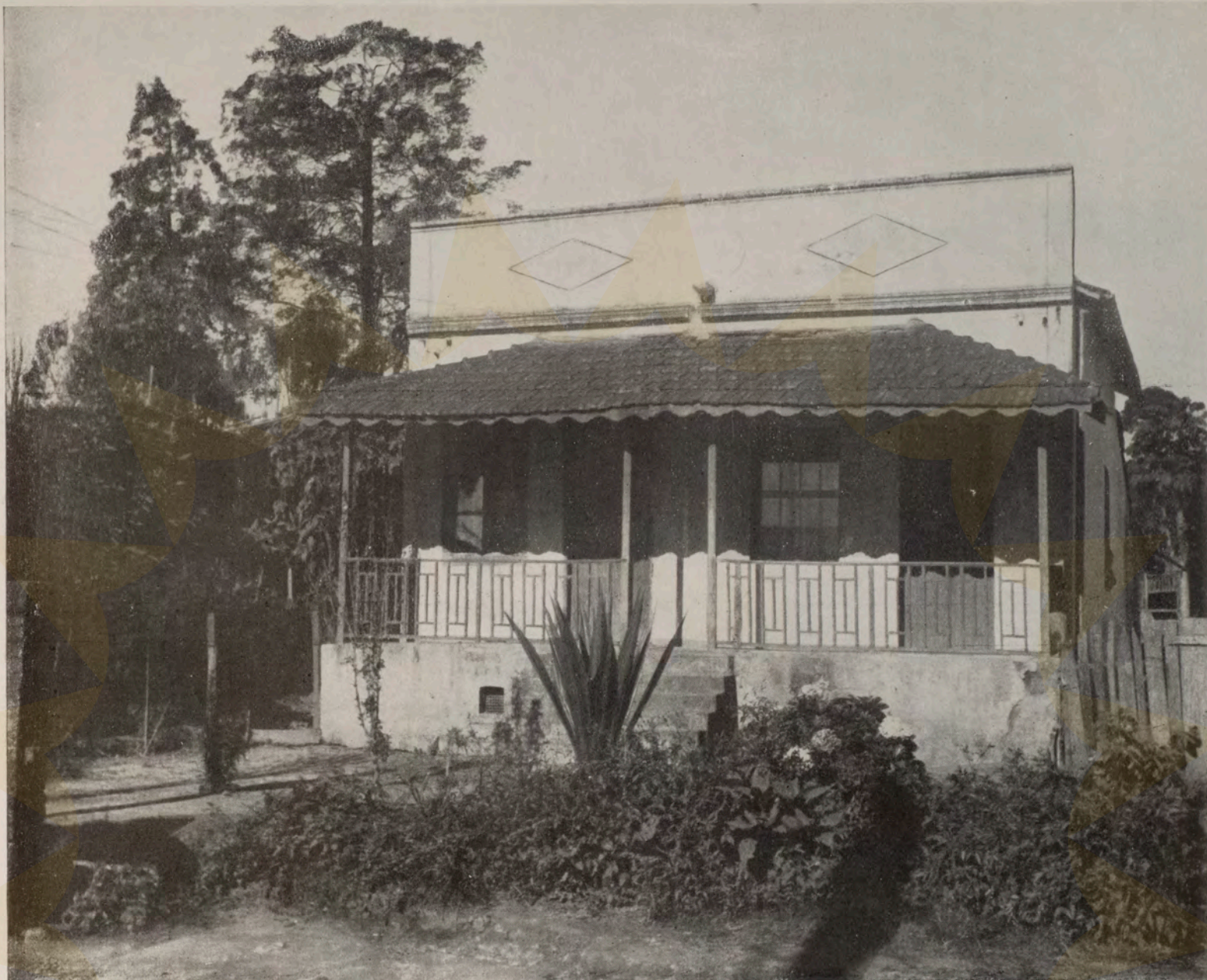
Casa do emigrante que quis fazer arquitetura, conseguindo-a