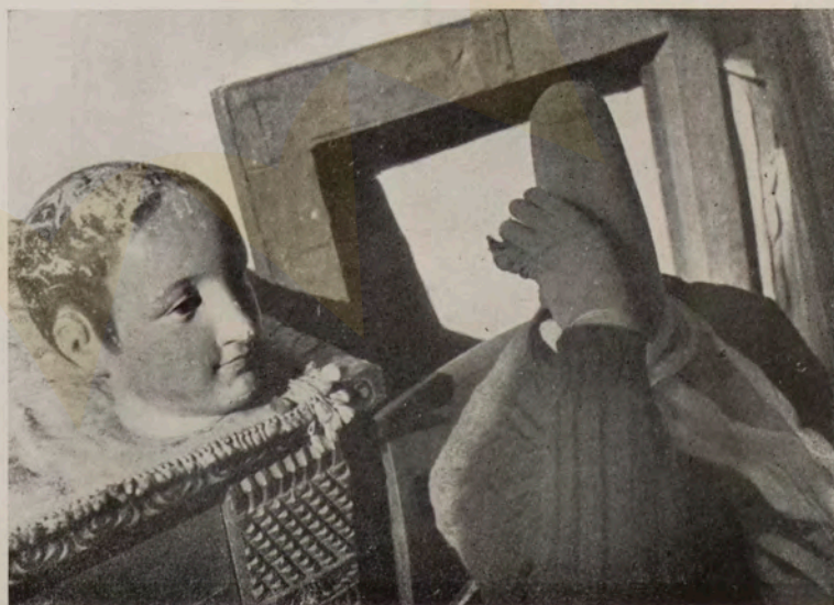
Conhecemos no Rio de Janeiro, faz alguns anos, um fotógrafo de valor, Sacha Harnisch; desejariamos ter suas notícias. A foto acima é dele