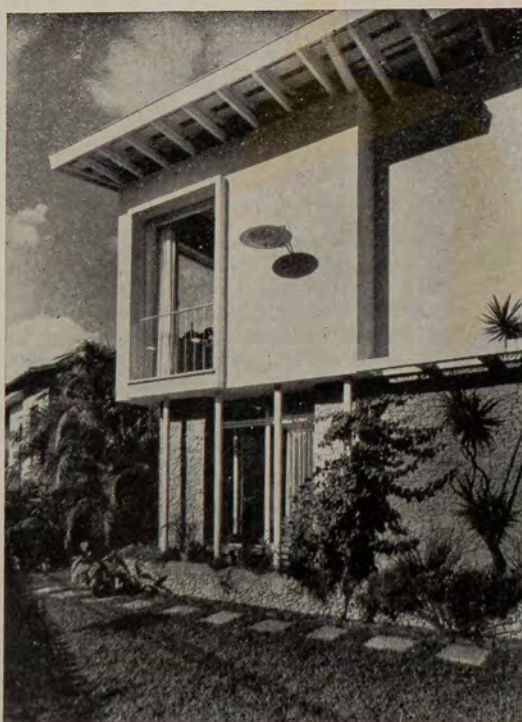
Outra vista da casa da Vila Paulista

A característica mais específica da arquitetura contemporânea é a identificação entre muros e planos. Vemos como a natureza concorda bem com essa residência da Vila Paulista. Projeto Escritório Técnico Bernardo Rzezak