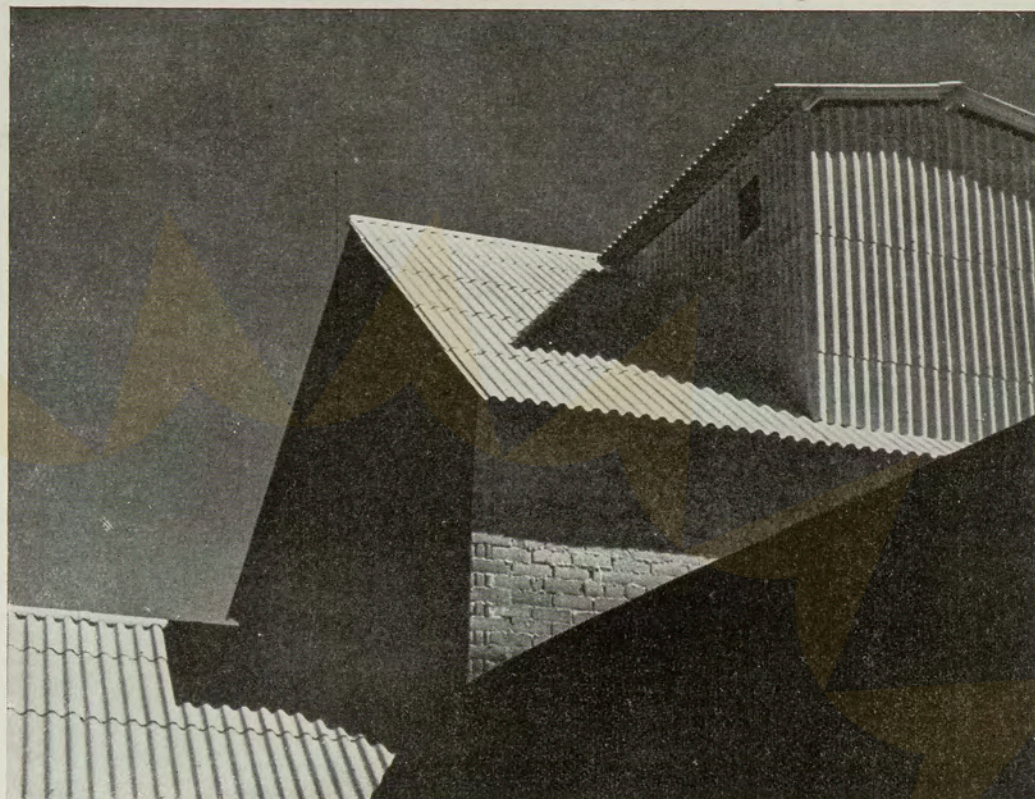
German Lorca, White Roofs