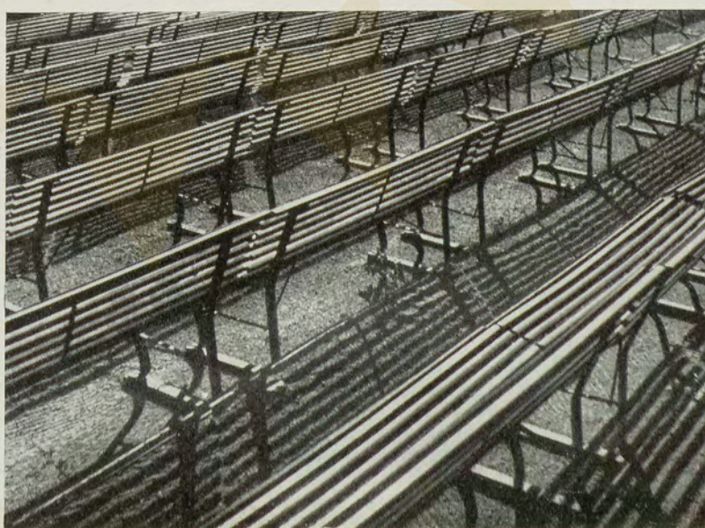
Gaspar Gasparian, Paralelas